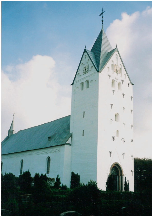
Ill. 1: Brøns kirke, et centralt element i slægtens historie, er en af landets længste landsbykirker. Den er som de fleste på egnen en romansk tufstenskirke og bygget i begyndelsen af 1200-tallet.

slægten hurtigt får bredt sig over et stort område. Således findes den allerede før år 1700 i store dele af Jylland, flere steder på Sjælland, bl.a. København, og er også etableret i Skåne, i Norge og syd for den nuværende dansk-tyske grænse.