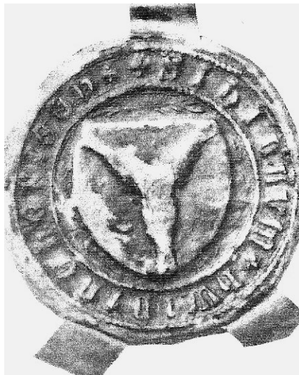
Ill. 5: Hviding herreds våben med tre fisk, der lægger hovederne sammen, i et eksempel fra 1434 (Paul Bredo Grandjean: Slesvigske købstæders og herreders segl indtil 1660 , Kbh. 1953, tavle 10d).