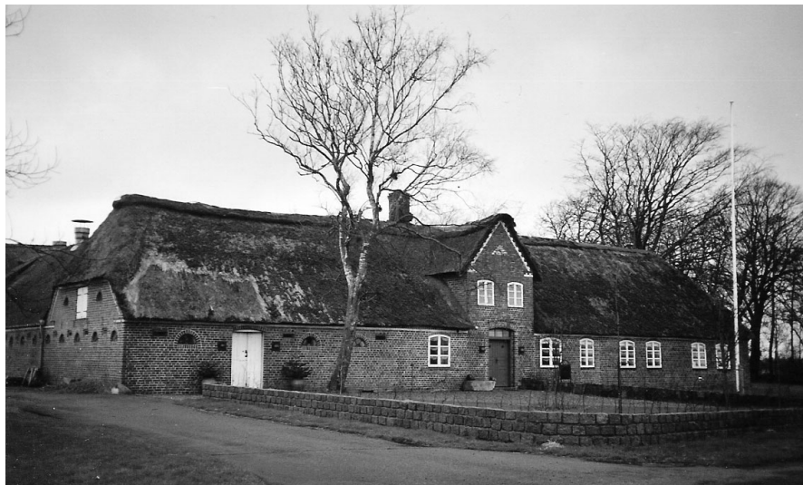
Ill. 7: Denne gård i Skast, beliggende ud til landevejen til Harris i Brede sogn, ligger hvor gården Beyerholm i sin tid lå.

(– ca. 1669), gmd. i Borrig, Brede Sogn. Stammor til Linie 10: Skastgård-linien .